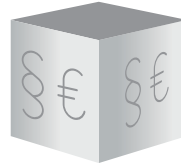
Haus- und Grundbesitzer- Haftpflicht